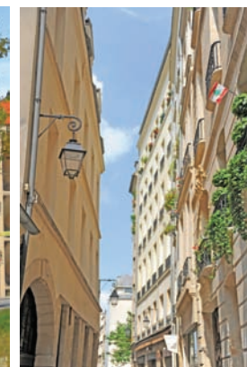
Liban au cœur France – 2008 Au hasard d'une promenade dans un quartier animé de Paris, sur le balcon du 1er étage, un drapeau libanais attire le regard. (90 x 60cm)