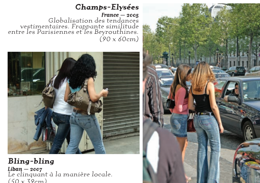
Bling-bling Liban – 2007 Le clinquant à la manière locale. (50 x 39cm)