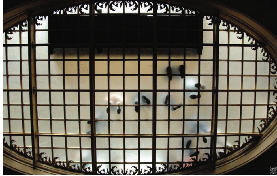
Pied(s)-à-terre France – 2007 (1.57 x 1m)

France – 2007 La silhouette d'une jeune femme apparaît derrière ce pont en forme d'accordéon. (1 x 3.50m)