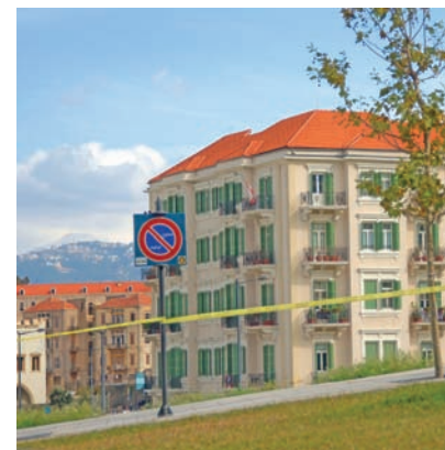
The brick house Liban – 2007 Centre-ville de Beyrouth avec vue sur les montagnes libanaises. Un drapeau national se dresse fièrement sur le balcon du dernier étage. (60 x 60cm)