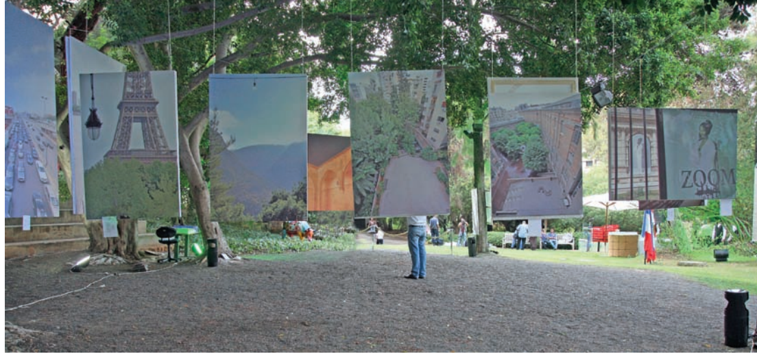
Une vue de l'exposition.

La production dans son ensemble, définit un rapport subjectif au monde, lié à la vision personnelle de l'artiste, apparaît pleine de fantaisie et de la quête d'une expression synthétique qui traduit