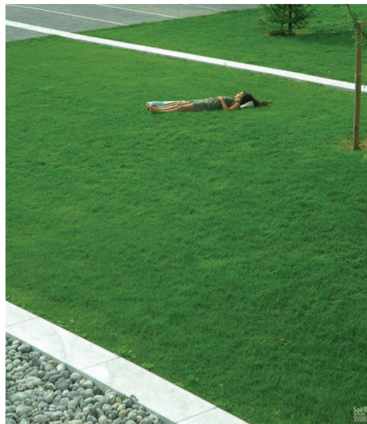
VERTébral France – 2007 (1 x 1.15m)